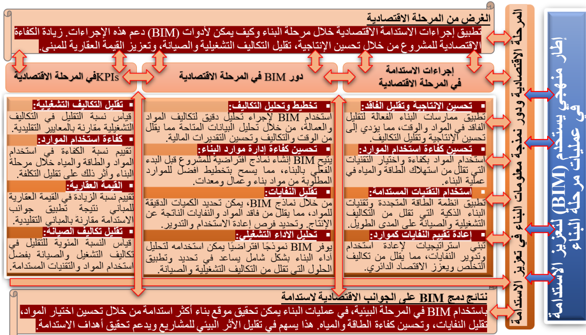
شكل رقم (٣) الإطار المنهجي لاستخدام BIM في تحقيق الاستدامة في الجوانب الاقتصادية (الباحث)