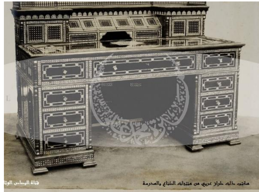
الصورة (5) توضح بعض اعمال المدرسة الإلهامية في قطع الأثاث.

ووفقاً لأحدث المناهج الوطنية الأساسية، فإن الحرف اليدوية هي مادة إلزامية، يأخذها الطلاب من الصف الأول إلى الصف السابع (الذي تتراوح أعمالهم من 7-13 عام) لمدة ساعتين في الأسبوع.