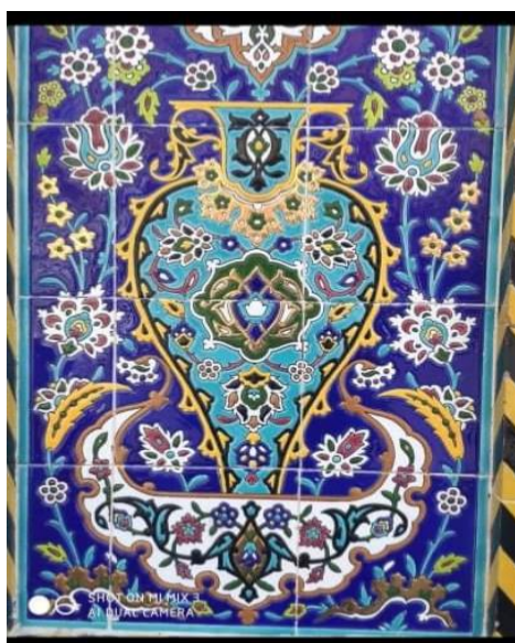
انموذج رقم (٤)

نفذت وفق الأجر وتعتبر من الزخارف البنيوية التي تنفذت فوق الأجر على شكل مربعات هندسية مزججة تنظم بنائها الشكلي وفق قياسات هندسية محسوبة من القياس والدقة في التنفيذ فيما تخلل أعلى القبة وتحت الشريط الزخرفي الدائري أشكالاً هندسية من الاعلى على شكل مثلثات مقلوبة الرأس الى الاسفل والقاعدة الى الاعلى مفتوحة مشكلة بذلك زخارف المثلثات المتجاورة التي استخدمت في بداية نشأت الزخرفة وقد استخدمت في العصر الاموي والعباسي كذلك لما للمثلث من قدسية عند العرب والمسلمين ،نفذت الزخارف على بدن القبة بالأجر المزجج (المربع) والقسم الاخر على شكل مستطيل والكتابات الهندسية بالكوفي المدمج كلها تميل الزخارف الهندسية التي تبنى على الحساب وفق قياسات محددة من المربع والمستطيل وتقاطع الخطوط الهندسية مشكلتاً بذلك الاشكال الهندسية التي تعتبر غاية في لابداع والجمال الهندسي .