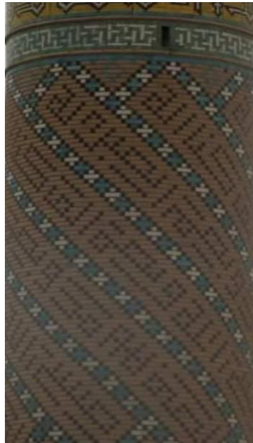
انموذج رقم (٣)

وإذا ما توجهنا لتتبع التصميم الزخرفي وما يشغل عليه ضمناً ، فتجدر الإشارة للوقوف على ما يخص المعالجات التصميمية التي اعتمد فيها على التوازن المتماثل والذي تحقق في نصفي التكوين الأيمن والأيسر ، فضلاً عن وضوحه في الشمس وما حولها كما تم إحداث التناسب في توزيع المفردات ومقاساتها الفنية ، وذلك من خلال حركية الأزهار وتوزيعها المنتظم أعلى وأسفل التصميم ، ولا سيما الأوراق والمقاطع الغصنية التي نفذها على مجمل المساحة التصميمية وبشكل مميز ، فضلاً عن اسنادها بالترار حول الشمس بالقلوب الفنية وتعاقيبة تنفيذها ، وما نتج عنه من إيقاع فني جميل وممتع ، مما بين توجه المزخرف في تنظيم مقاطع النتاج الزخرفي بشكل موحد، واجملاً قد أظهر مهارته وجمالية توزيع عناصره الفنية وموهبته في استثمار المفردات وصولاً لتحقيق الغاية الفنية المرجوة .