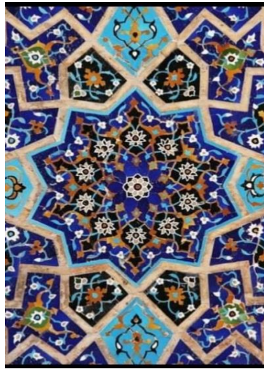
انموذج رقم (٥)

الشكل العام عبارة عن شكل هندسي مستطيل نفذ على أحد واجهات المسجد ( بالآجر المزجج ) قسم الشكل أو على شكل مربعات هندسية ومستطيلات بما يتناسب وتصميم القطع السيراميكية على الأرضية، ثم بعد ذلك ترقم ((القطع الآجرية)) من الأسفل ويقوم المزخرف بتصميم الشكل بما يتناسب وحجم الفضاء المخصص (الأرضية) الشكل الزخرفي متناظر من الجهتين (بالتكرار) عبارة عن قلب زخرفي يتوسط الأرضية بزخارف نباتية من الورود والأزهار بما يسمى ((القلب الزخرفي)) بزخارف (الهلكار) زينت أرضية الشكل بالوسط باللون (الشدري) فيما تخلل وسط القلب الزخرفي شكل زخرفي عبارة عن زخارف (اسلامية قديمة) أرضيتها باللون الأخضر فيما تخلل تاج القلب الزخرفي من الأسفل عبارة عن زخارف مقرنصة ممتدة الجانبية التاج من الجهتين زينت بأرضية بيضاء والزخارف والورود بدرجات الأزرق والقهوائي فيما تخللت الزخارف على الجانبين زخارف عبارة عن ورود وأزهار نفذت على أرضية باللون الأزرق والورود باللون الأبيض والأصفر والقهوائي ، امتدت الزخارف التي خارج القلب الزخرفي من الأسفل الى الأعلى ، وهي تعبر عن الأمتداد الروحي للعقيدة الإسلامية التي امتدت من الأرض الى السماء ، الشكل جاء بشكل متناظر بطريقة التكرار غاية البساطة والدقة في البناء الهندسي من خلال تقسيم (الفضاء) الأرضية الى مربعات ومستطيلات بما يتلائم وحجم القطع الآجرية المزججة لتعبر عن غاية في التزيين والجمال لواجهات المساجد .