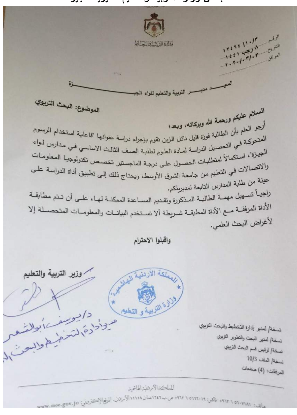
ملحق رقم (12) كتاب من وزارة التربية والتعليم لمديرية الجيزة