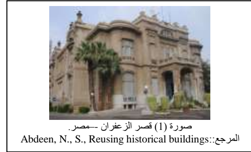
صورة (1) قصر الزعفران -مصر-

هو التكامل في الفكر العمراني و الاجتماعي و الاقتصادي، فهو يهدف إلى الارتقاء بالمجتمع و الفرد، و البيئة التي يعيش فيها المجتمع، وهذه مسألة لا تتفصل عن النشاط و الممارسات الاقتصادية. كما هو سياسة التنمية الشاملة للبيئات العمرانية على كافة محاورها.