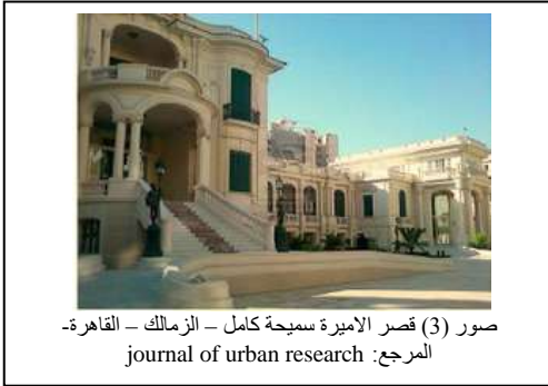
صور (3) قصر الاميرة سمحة كامل - الزمالك - القاهرة

يقصد به أن الوظيفة الجديدة التي يقوم بها المبنى ليس لها القدرة على إنتاج دخلا ماديا يغطي تكاليف الترميم و الصيانة الدورية إنما يوفر للمبنى منفعة ثقافية أو اجتماعية للمحيط العمراني له، ومن أمثلة هذا النوع من الاستخدام المتاحف، المكتبات العامة، المعارض وغيرها من الأنشطة الاجتماعية والثقافية.