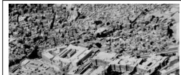
صورة (7) منطقة الحطابة - القاهرة التاريخية

تعد الحطابة نموذجا للنسيج العمراني للقاهرة التاريخية حيث يوجد تجمعات من المباني التاريخية و الآثار يجب الحفاظ عليها وإعادة استخدامها، كما ان نسيجها العمراني تاريخي لم يتغير منذ توثيقه من خلال خريطة وصف مصر عام 1801م. منذ تأسيس الحطابة في العصر المملوكي كانت امتدادا سكنيا لقلعة صلاح الدين ، ثم أصبحت في العصر العثماني منطقة خدمية و حرفية تمد القلعة و الأحياء المجاورة بالحطب و الأخشاب.