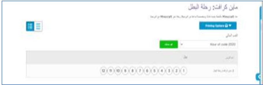
شكل (٥) مستويات التعلم داخل بيئة تعلم محفزات الألعاب الإلكترونية

❖ تصميم مستويات التعلم داخل بيئة التعلم القائمة على الألعاب الإلكترونية، حيث تم تصميم مستويات التعلم للمجموعة التجريبية لتتضمن سبع مستويات وقبل المستويات يوجد مجموعة من الأسئلة التي تمثل التطبيق القبلي، يطلب من الطلاب الإجابة عليها ويقوم الملاحظون بتقييم الأداء وفق بطاقة الملاحظة التي تم إعدادها لهذا الغرض، ثم ينخرط الطلاب في التعلم وفق الجدول الزمني المعد لتدريس المقرر وتنفيذ المهام من خلال سبع مستويات لكل موضوع من موضوعات المقرر، وبعد ذلك يخضع الطلاب لمجموعة من الأسئلة كتطبيق بعدي على أن يقوم الملاحظون بتقييم الأداء وفق بطاقة الملاحظة لمعرفة مدى التحسن في مهارات البرمجة لدى الطلاب ويوضح الشكل التالي مستويات التعلم.