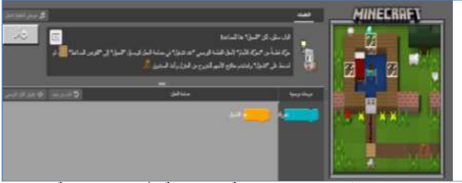
شكل (٤) قواعد العمل داخل بيئة تعلم برمجة الألعاب الإلكترونية

❖ تصميم القواعد داخل بيئة الألعاب الإلكترونية: حيث تم وضع مجموعة من القواعد التي يجب أن يلتزم بها الطلاب أثناء التعلم والتي يوضحها الشكل التالي: