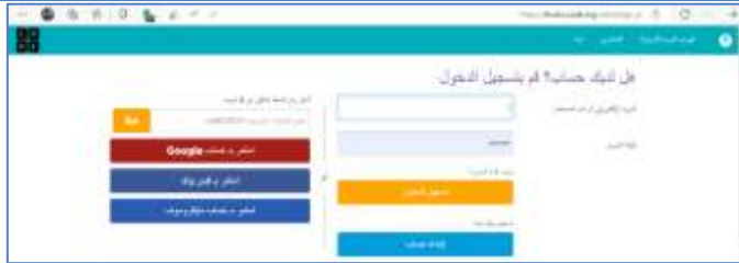
شكل (٣) شاشة الدخول لبيئة تعلم البرمجة من خلال الألعاب الإلكترونية