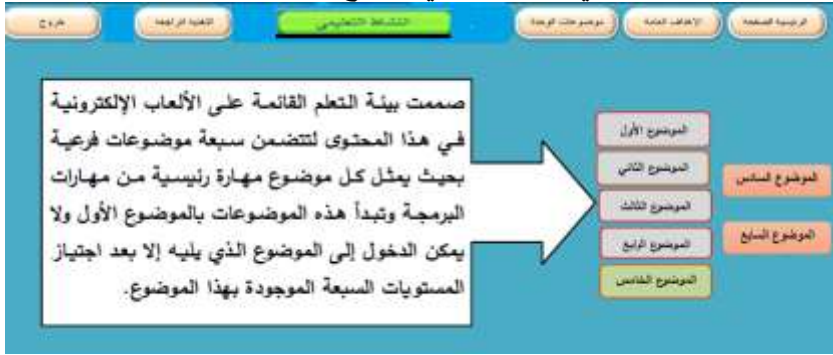
شكل (٦) التبويب داخل بيئة تعلم محفزات الألعاب الإلكترونية

❖ تصميم الدروس التعليمية داخل بيئة التعلم القائمة على الألعاب الإلكترونية: تم تصميم الدروس بحيث يكون هناك تبويب يعرض الأهداف العامة للمحتوى ثم موضوعات المحتوى والتي تم تقسيمها إلى سبعة موضوعات كل موضوع يتضمن مهارة رئيسية من مهارات البرمجة التي تم التوصل إليها في قائمة المهارات التي أعدها الباحث ومرتببة بشكل منطقي، بالإضافة إلى زر الانتقال إلى النشاط التعليمي والشكل التالي يوضح ذلك: