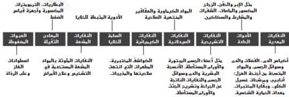
شكل (1): أنواع النفايات الطبية