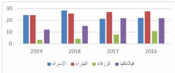
الشكل ( 1 ) صافي الربح الى الإيرادات

ويظهر الشكل ( 1 ) التالي هذه النتائج بصورة بيانية: