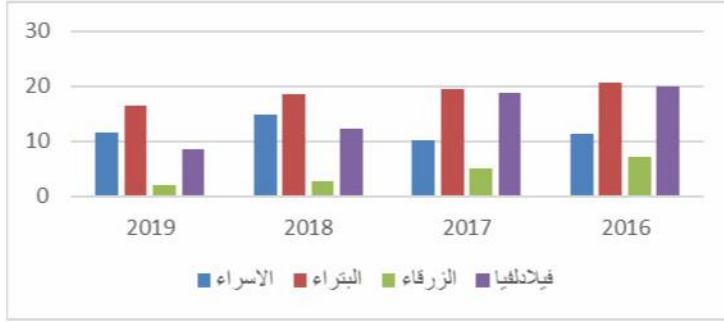
الشكل ( 3 ) العائد على حقوق المساهمين

20.589% ، بينما كان ادنى عائد على حقوق المساهمين قد حققته جامعة الزرقاء 2.113% . كما يلاحظ أن سنة 2016 كانت الأفضل أداء وقد تأثرت بنتائج كل من جامعة البترا وجامعة فيلادلفيا. ويظهر الشكل ( 3 ) التالي هذه النتائج بصورة بيانية: