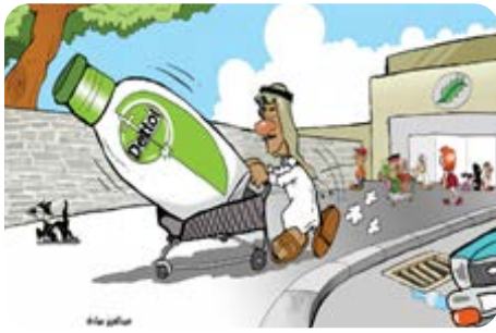
الرسم الكاريكاتيري (17)

تحيط بالتعقيم ومستلزماته، فالأبيض يأتي إشارة رمزية إلى الزي الطبي الذي يلبسه الأطباء، كما أنه لون الوضوح. أما ما يحيط بهذه المعقمات من الخارج فهو لون أسود يشير إلى العتمة وعدم الرؤية. وتأتي العنونة أعلى الأشكال الأيقونية لتضافر المعنى وتؤكد عليه من خلال كتابتها باللون، وتعبير عنه بلفظ «أصدقاء» الذي يشير إلى الود والألفة والترابط. فالرسام يختصر صفحات من الكتابة، وعشرات الكلمات في الخطابات اللغوية ليدل على أهمية الوقاية من خلال الرسم المعبر.