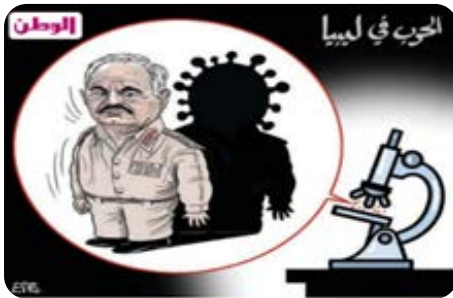
الرسم الكاريكاتيري (43)

أما على المستوى الإقليمي العربي، فقد كانت أوضاع ليبيا وسوريا حاضرة في مضامين الكاريكاتير، كما عبّر الرسامون عن تفكك الدول العربية وتباعدها، ففي الرسم الكاريكاتيري (43) لصليبا، يظهر حفتر قائد ما يعرف بالجيش الليبي الوطني رمزًا استعاريًا لفيروس كورونا، وأمامه المجهر الذي جاء كاشفًا دقيقًا للدور العسكري الخطير؛ فالفيروس الأخطر على ليبيا هو التدخل العسكري لهذا الجيش. ولا تكتفي الصورة بهذا المعنى، فهي تحيط الأشكال الأيقونية فيه بهالة من اللون الأسود للدلالة على حالات الغم والكآبة، والأوضاع السيئة.