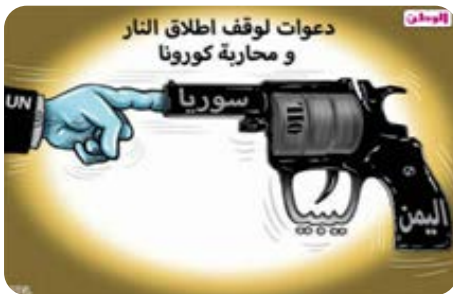
الرسم الكاريكاتيري (44)

وفي تصوير الوضع في سوريا، يوضح الرسم الكاريكاتيري (44) لصليبا أيضًا حالة الحرب الدائرة هناك، فالمسدس عُنون باسم سوريا، ولونه الأسود جاء معبرًا عن حالة الشقاء والأسى، وتظهر محاولات الأمم المتحدة وقف الحرب هناك بسبب الجائحة، غير أن دلالة الأصبع الواحد تدل على صعوبة الحيلة في منع الحرب أو إيقافها على الأقل، فاليد كلها تستخدم للدلالة على الردع غالبًا. ولا يغفل الرسام في رسالته الكاريكاتيرية توظيف الألوان لدلالاتها في إيصال المعاني أيضًا؛ فالهالة حول المسدس تشير إلى محاولة تحقيق التوقف من خلال الأمل الذي يستلزم اللون الأبيض في الوسط، وفي الأطراف يظهر اللون الأصفر والأسود اللذان يوحيان بالقلق والتوتر الذي يُرجى زوالهما.