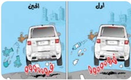
الرسم الكاريكاتيري (18)

كما يوظف صادق تقنية المقارنة بين الشئيين لبيان التحول في الممارسات السلوكية التي ظهرت مع الجائحة، فهو يعتمد اعتماداً كلياً على هذا الأسلوب في أكثر من خطاب كاريكاتيري، فهذه التقنية تأتي «لإبراز فكرة ما، ويلاحظ أيضاً أنها تهكّم على المعايير والمواقف المجتمعية» (Shaikh, Tariq & Saqlain 86). فمن خلال ملاحظة عدد من التصرفات في المجتمع القطري تلقي بعض الرسوم الكاريكاتيرية الضوء على التحولات التي أنتجت الأزمة، ففي الرسم الكاريكاتيري (18) يقارن صادق بين نوعية القاذورات التي يلقىها سائق السيارة سابقاً وبين القاذورات التي يلقىها أثناء الأزمة،