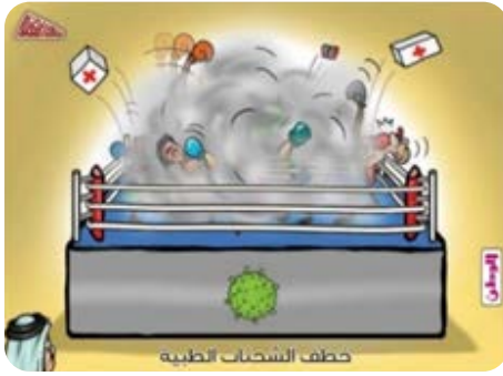
الرسم الكاريكاتيري (42)

الشرعية، ومهاجرون أوروبيون يُطردون من القارة الأفريقية؛ نظرًا إلى انتشار الوباء في بلدانهم. ولا شك في أن التركيز على البحر له مؤداه في الصورة من حيث هو سبيل الهجرة غير الشرعية، فهو يذهب بقراءات متعددة عند المتلقي ليذكر بمآسي أولئك المهاجرين الأفارقة وما يتعرضون له من