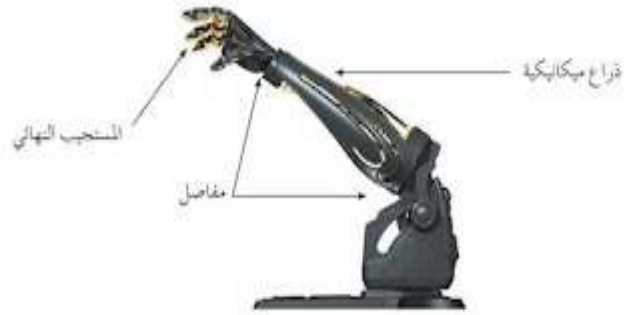
شكل (1-2)مكونات الروبوت البسيط