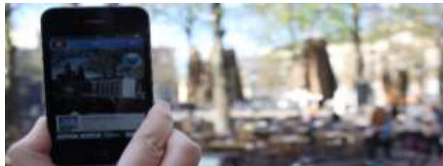
شكل ( ١ ) تطبيق UAR Underground ، يعرض المباني الماضية والمستقبلية في Den Haag (١)

إن مزايا الواقع المعزز في الهندسة المعمارية هائلة. الواقع المعزز هو أي نظام يمزج العالم الحقيقي بالمعلومات الرقمية التي يبدو أنها تتعايش مع العالم الحقيقي. وسيصبح استخدام تطبيقات الواقع المعزز في قطاع الهندسة المعمارية مهم ، مثل نمذجة معلومات البناء . (BIM) تشير تطبيقات الواقع المعزز اليوم إلى مستقبل زاهر: ففي موقع البناء تسمح للبناء برؤية الأنابيب والقنوات الميكانيكية خلف الجدران، وتراكبات المباني الماضية والمستقبلية تظهر على تطبيقات الواقع المعزز و تجعل المدينة لوحة بيانات افتراضية. بينما يتسابق مستخدمين تكنولوجيا تطبيقات الواقع المعزز لإطلاق نماذج ثلاثية الأبعاد وبيانات رقمية من أجل زيادة العالم المادي من خلال أجهزة العرض ، التغيير السريع الذي تقوم عليه تقنية الواقع المعزز أن العاملين في هذا المجال يجب أن يكونوا على دراية كافية بتطورات الواقع المعزز . حيث يتم الكشف عن فرص جديدة وحل العوائق الحالية. و يوضح هذا البحث تعريفات الواقع المعزز ومجالات استخدامه كما في الشكل (١) في الهندسة المعمارية ومزايا تطبيقات الواقع المعزز ومشروعاتها التطبيقية والعوامل المؤثرة سلباً على تطوير واستخدام تطبيقات AR