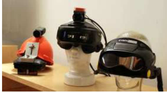
شكل ( ١٣ ) النموذج الأولي لشركة HMD (على اليمين) ، ونظارة Google Glass (على اليسار).