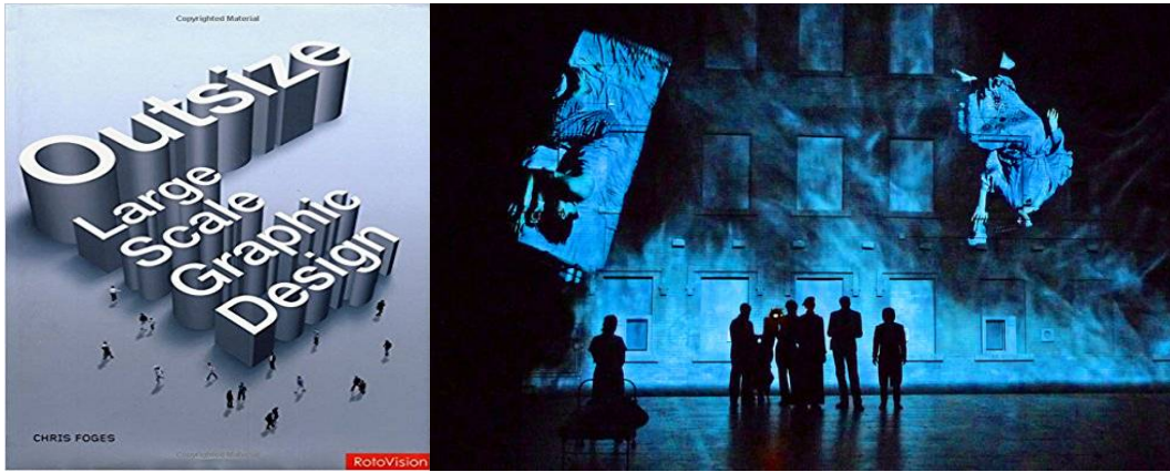
Large scale graphic designs