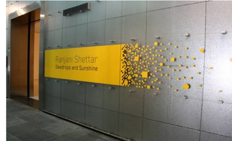
Environmental graphic Signage